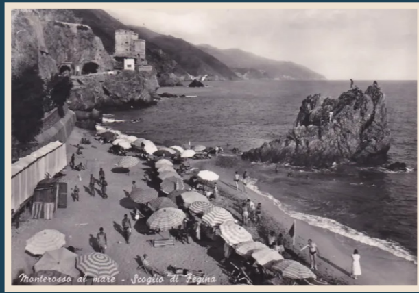
Monterosso al mare - Scoglio di Regina